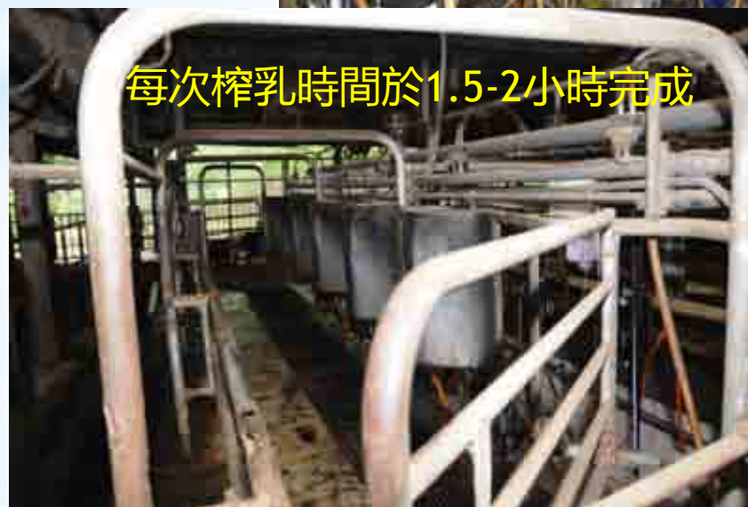
每次榨乳時間於1.5-2小時完成